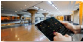
Anlagen- und Gebäudebewirtschaftung