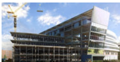
Architektur & Bauwesen