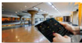
Anlagen- und Gebäudebewirtschaftung