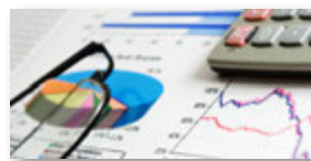
Finanz- und Rechnungswesen