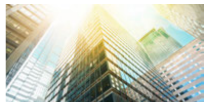
Banken & Kommunen