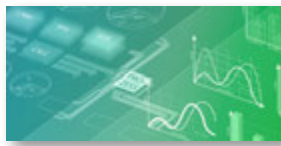
ERP – Enterprise Resource Planning