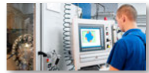
MES – Maschinen- datenintegration