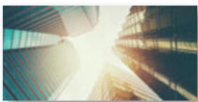
BIM – Building Information Modeling